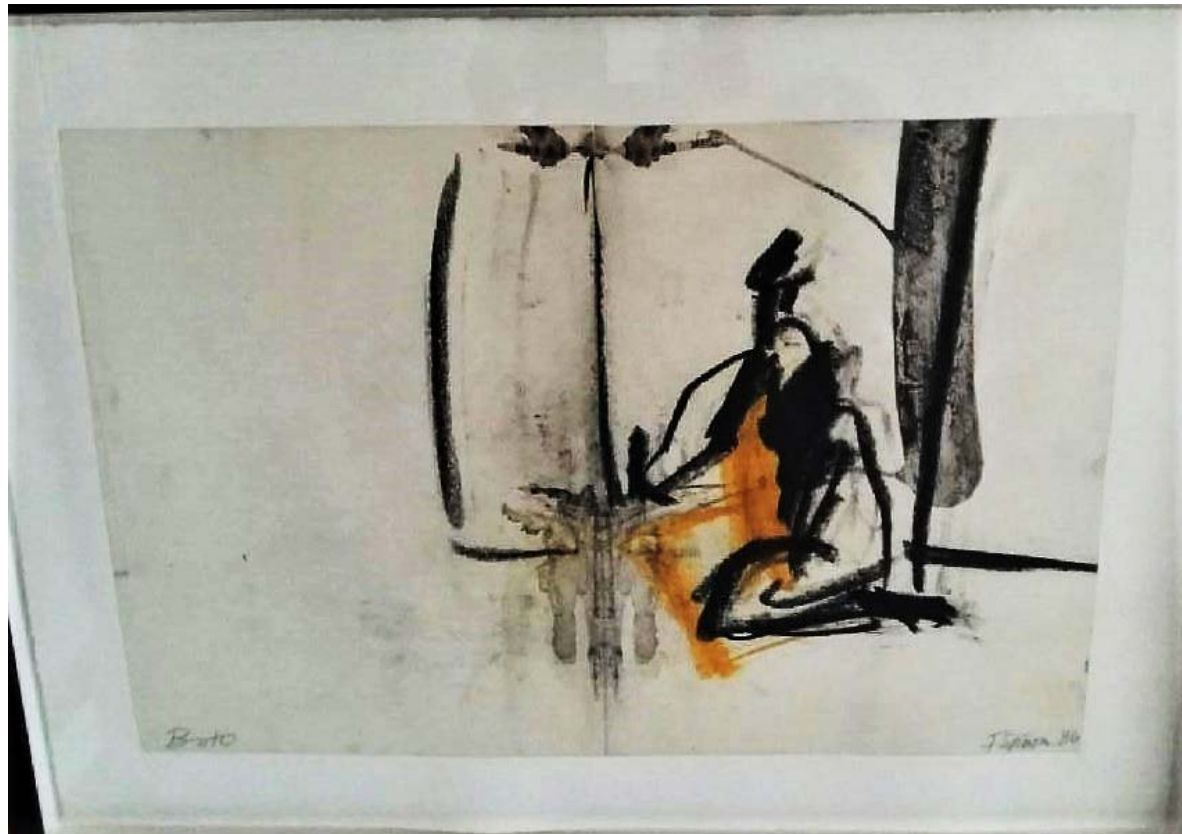
Buto Technique mixte sur chine marouflé, 1986 45 x 65 cm Prix : 3 000$

Nous vous proposons un dessin d'une série très prisée, Buto de 1986.