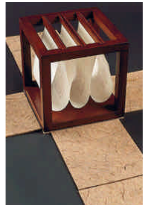
PARFOIS LES ASTRES 2000

Gilles Cyr, poèmes. Vivian Gottheim, illustration. Papiers Kuro double, Strathmore. 1993 100 exemplaires 125 $ 95 €