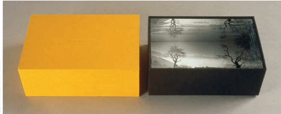
LE 6 AVRIL 1944 1999